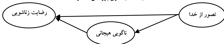
شکل ۱: مدل نظری پژوهش حاضر